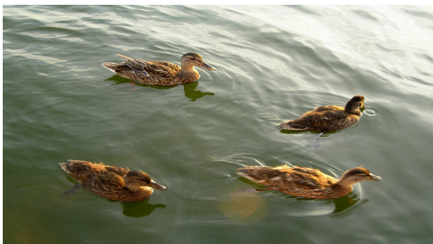
Endwirt Wassergeflügel