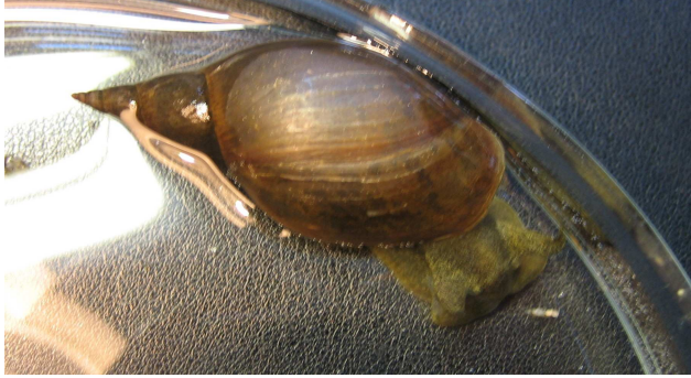
Zwischenwirt Lymnaea stagnalis