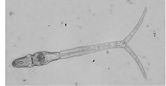
Gabelschwanz-Zerkarie, mikroskopische Aufnahme